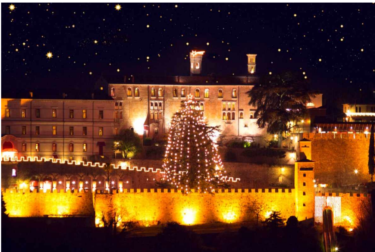
Albero di Natale più alto d'Italia

Si fa presto a dire albero di Natale ma dove fanno quello più grande d'Italia? Continuando a leggere potrai scoprirlo e, magari andarlo a visitare durante le vacanze.